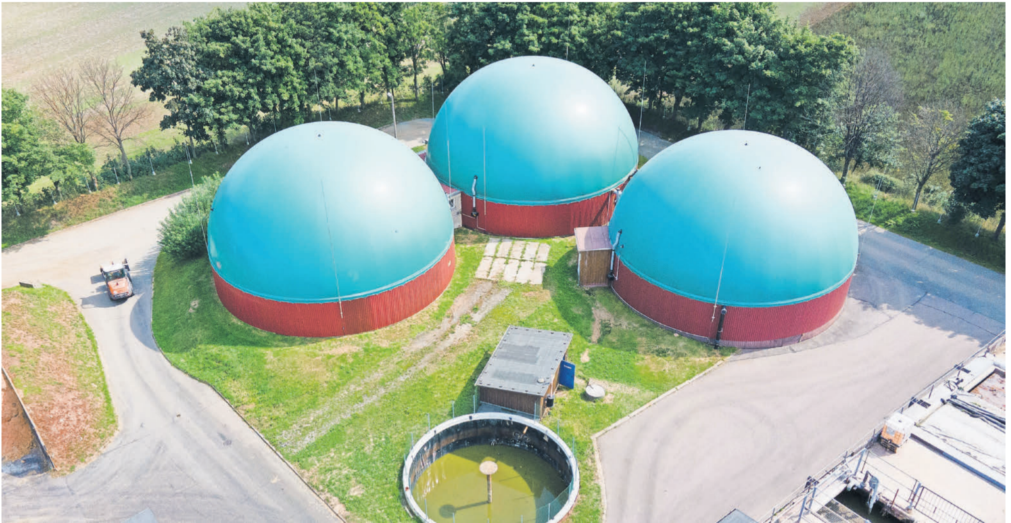
Eine Biogasanlage aus der Vogelperspektive: Die Kraftwerke mit den markanten Kuppeln sind ähnlich klimafreundlich wie die stark schwankende Energie aus Windkraft und Photovoltaik. Doch das Leistungsziel für 2030 ist schon längst erreicht, deshalb sollen Förderungen auslaufen.